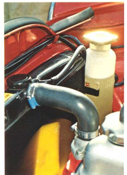
Slutet kylsystem, frossäkert ner till -40^{\circ}

Slutet kylsystem, frostskyddat ned till -40^{\circ}\text{C} , säkrar effektiv kylning – och uppvärmning – under alla förhållanden.